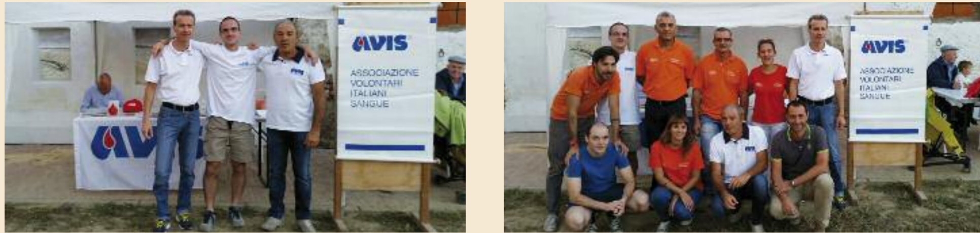
Gruppo AVIS Guardamiglio

Nelle giornate di Sabato 5 e Domenica 6 Settembre, il Palazzo "Zanardi-Landi" di Via Roma, di cui si è recentemente ultimato il recupero e quindi restituito alla cittadinanza guardamigliese, ha ospitato i festeggiamenti per i 10 anni del gruppo AVIS locale e dell'associazione "Pro Loco". La manifestazione è iniziata nel tardo pomeriggio di Sabato con l'apertura dello stand gastronomico e poi proseguita con il "rhythm and blues" abilmente eseguito per tutti gli intervenuti dai "Bluesberries".