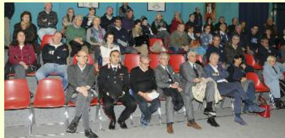
Il pubblico presente alla serata