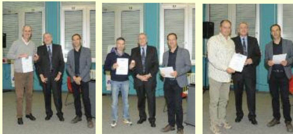
Alcuni donatori premiati nel corso della serata