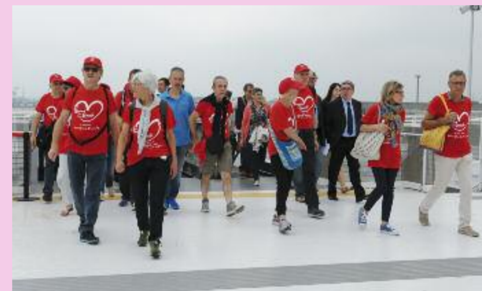
L'arrivo a Expo con le magliette ufficiali della giornata