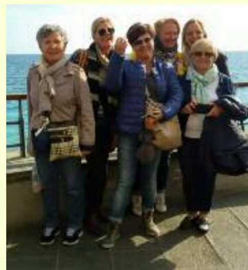
Gita a Sestri Levante, al mare

Il 3 Ottobre l'Avis di Casalpusterlengo ha realizzato una gita a Sestri Levante per conoscere i rappresentanti dell'Avis di Sestri. Sestri è una città bellissima, che si trova in Liguria, vicino alle Cinque Terre. Quando siamo arrivati, ci siamo divisi in due gruppi. La maggior parte dei partecipanti sono andati a fare un'escursione sul promontorio che si affaccia sulla Baia del Silenzio, mentre gli altri potevano andare alle Cinque Terre o dove volevano. Io e la mia famiglia siamo andati a Monterosso e là c'era il sole, mentre quelli che hanno fatto la camminata hanno preso tanta acqua, perché nel pomeriggio si è scatenato un temporale fortissimo.