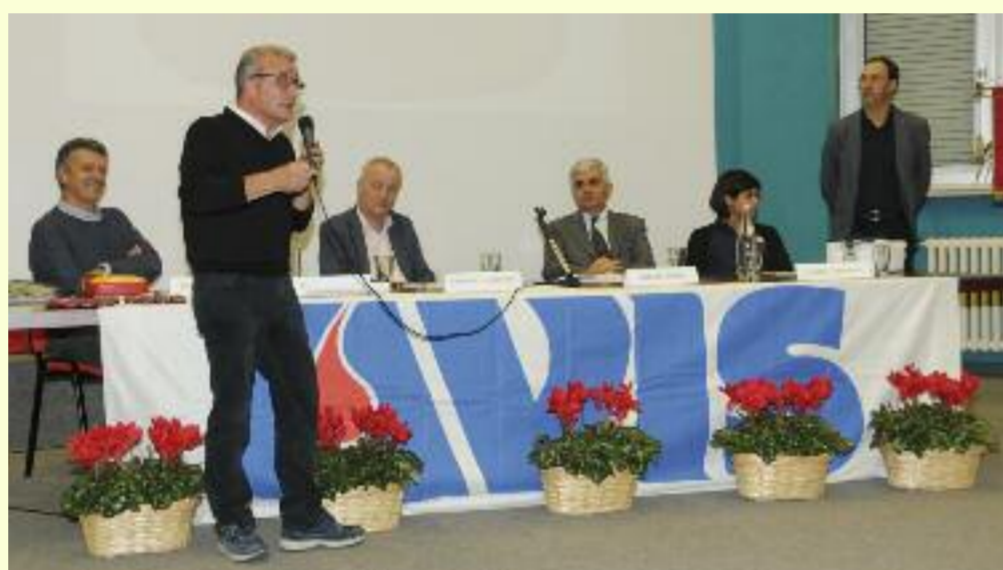
La tavola rotonda