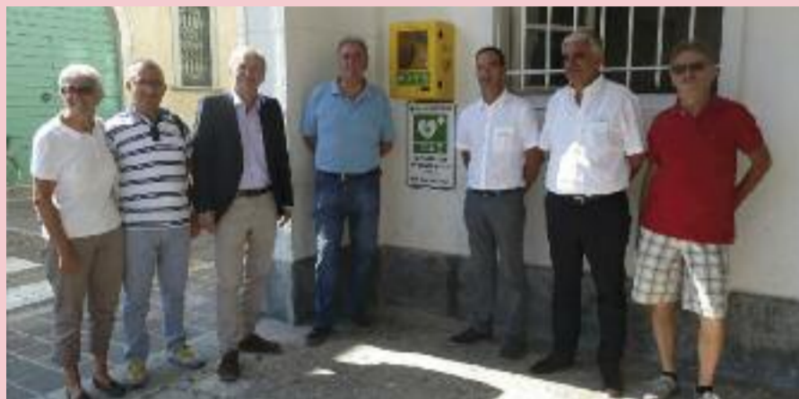
Inaugurazione defibrillatore al Municipio

Il progetto "Cuore Sicuro" si è concluso. In data 28 Agosto sono stati posizionati due DAE, defibrillatore automatico esterno: uno sotto il portico del Comune di Casalpusterlengo ed uno davanti alla Farmacia Comunale di Via Gramsci, quest'ultimo donato dall'Azienda Speciale dei Servizi di Casalpusterlengo. Avis, inoltre, ha contribuito alla donazione di altri quattro defibrillatori per le scuole cittadine. Prossimamente la Croce Casalese organizzerà corsi di formazione per l'utilizzo di questi dispositivi.