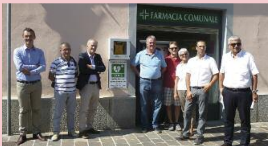
Inaugurazione defibrillatore alla Farmacia Comunale