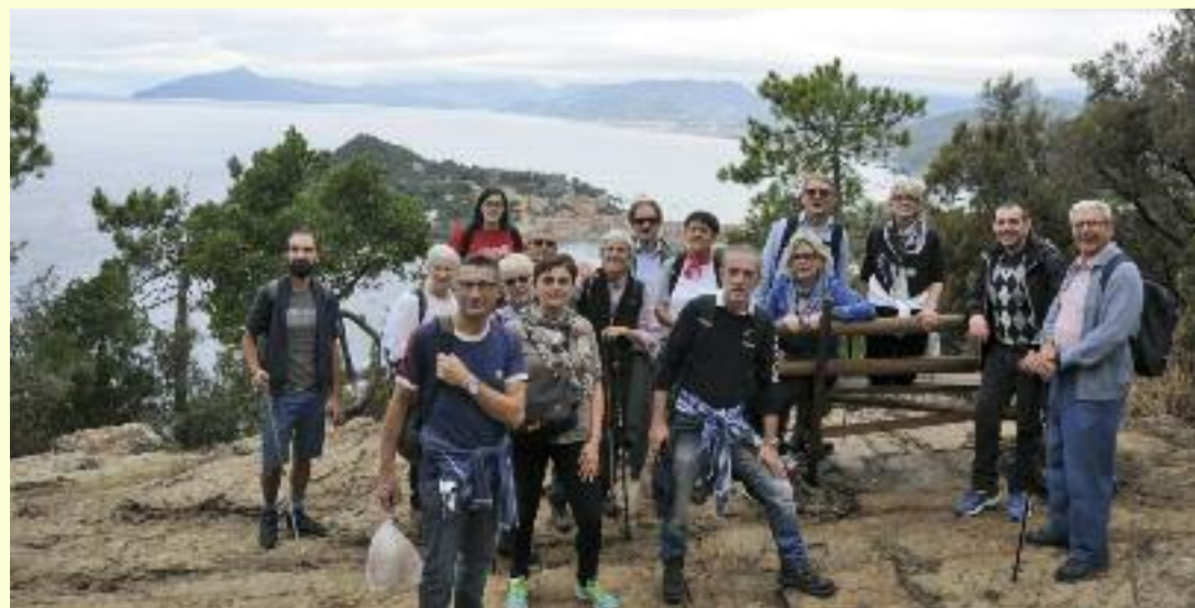
Gita a Sestri Levante, in escursione