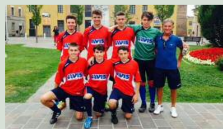
La squadra AVIS al torneo